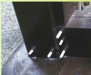
②モクボープラグを挿入する。