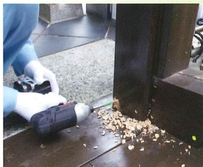
①直径9mm×長さ80mmの穴をあける。