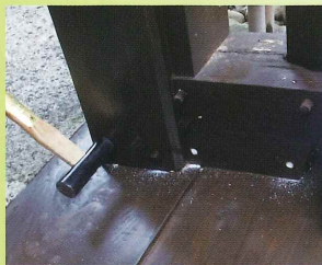
③ハンマーで打設する。