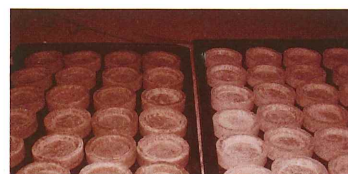
床下に設置したモルタル試験皿の様子